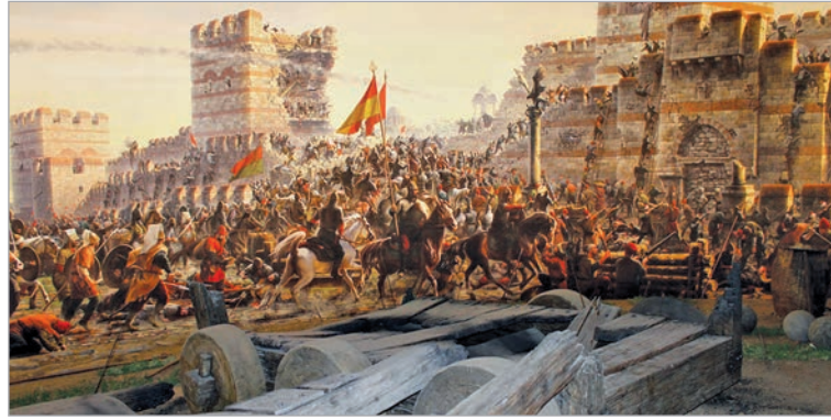
مستند ٣: صورة تعبيرية لفتح القسطنطينية.