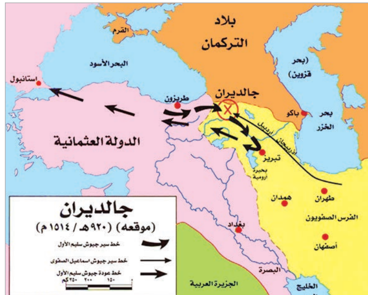
مستند ٤: معركة جالديران.