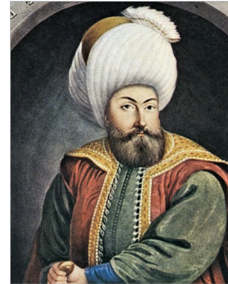
مستند ١: عثمان الأول مؤسس الدولة العثمانية.

يعود أصل العثمانيين الأتراك إلى بلاد تركستان وهم ذوو أصول مغولية قدّموا إلى بلاد الأناضول (في تركيا)، والتحقوا بخدمة السلاجقة (١) ، واعتنقوا الإسلام. ثمّ استقلّوا عن السلاجقة، وأنشأوا دولة في العام ١٢٩٩ عُرفت بالدولة العثمانية نسبةً إلى عثمان بن أرطغرل (١٢٥٨ - ١٣٢٤). وقد امتدّت الدولة العثمانية في ما بعد من البلقان حتى المشرق العربيّ والمغرب واستمرت حتى القرن السادس عشر.