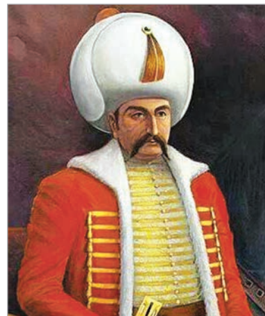
مستند ٥: السلطان سليم الأول.