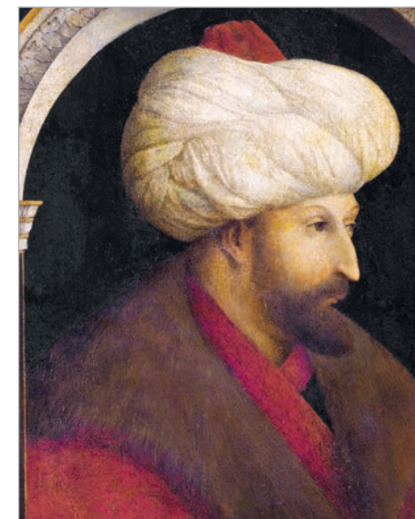
مستند ٢: السلطان محمّد الثاني الملقّب بـ«الفاتح».

كانت القسطنطينية عاصمة الإمبراطورية البيزنطية، فتحها السلطان العثمانيّ محمّد الثاني (١٤٥١ - ١٤٨١) في العام ١٤٥٣، فلُقّب بعدها بـ«محمّد الفاتح». وغدت القسطنطينية العاصمة الجديدة للسلطنة العثمانية، ودعيت أولاً «إسلامبول»، ثمّ عُرفت بـ«الآستانة». وتعرف حالياً باسم اسطنبول (Istanbul).