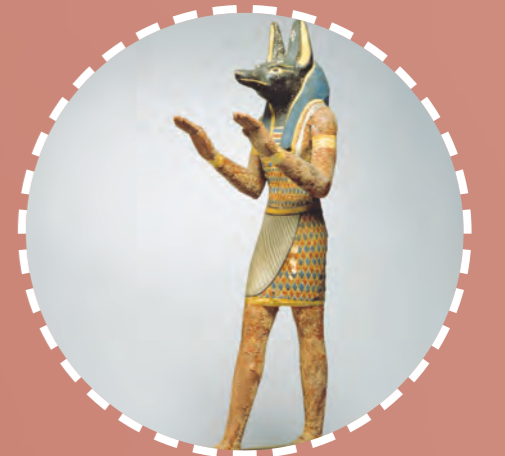
تمثال إله أنوبيس إله الموت