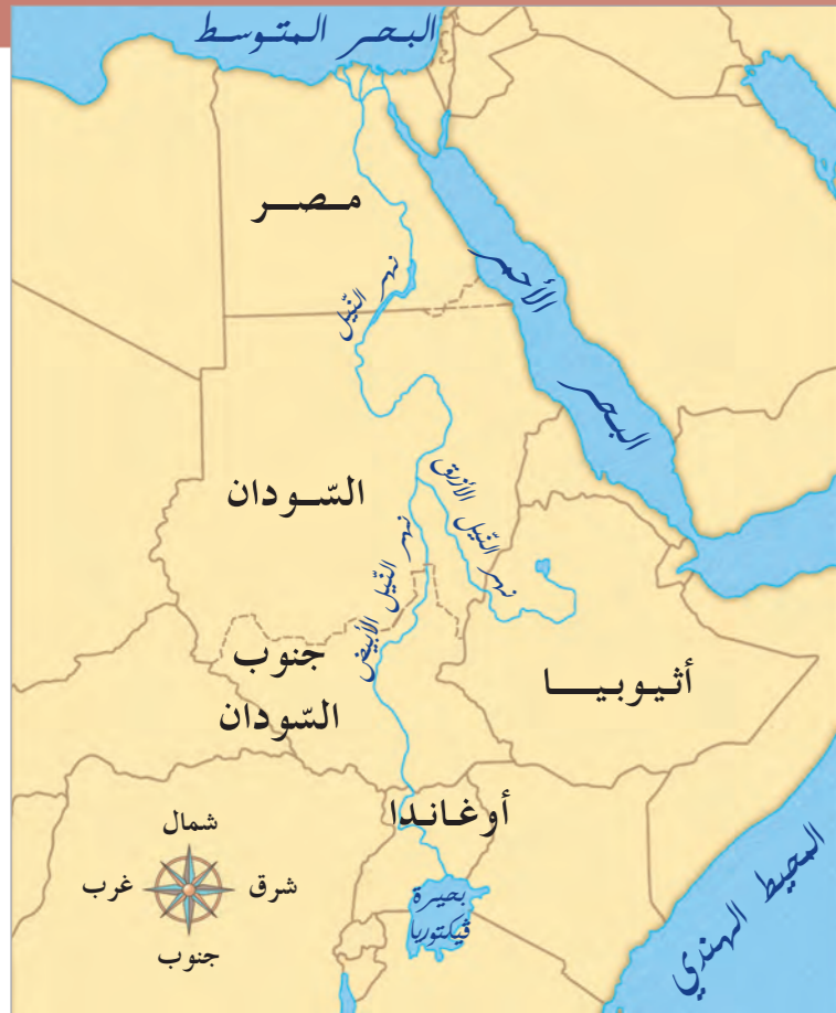
خريطة مجرى نهر النيل من منبعه وصولاً إلى مصر

نظراً إلى موقع مصر الجغرافي، يسيطر المناخ الصحراوي على كامل أراضيها، وينعدم هطول الأمطار باستثناء كميات قليلة في الشمال، لذلك لم تكن تصلح للسكن، لولا نهر النيل (١) الذي يقطعها من الجنوب إلى الشمال، فجعلها واحة خصبة. من هنا نفهم معنى قول المؤرخ اليوناني هيرودوتس (٤٨٤ - ٤٢٥ ق.م) إن «مصر هبة النيل»، وهو يقصد أن النيل هو من وهب مصر الحياة.