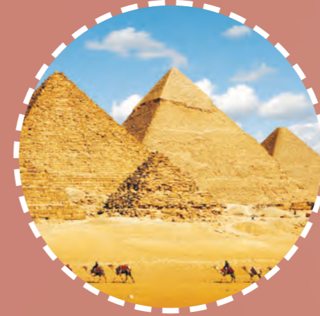
أهرام الجيزة في مصر