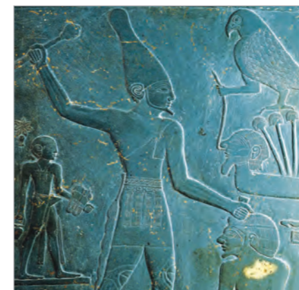
نارمر ملك مصر العليا

في العام ٣٢٠٠ ق.م. تمكّن ملك مصر العليا نارمر (مينا) من توحيد البلاد تحت سلطته، واتّخذ لنفسه لقب فرعون، وأقام في مدينة تيس التي جعلها عاصمة للدولة.