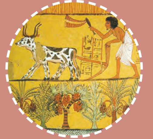
الزراعة المصريّة القديمة