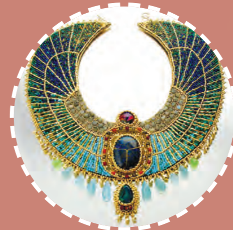
مجوهرات مصريّة قديمة