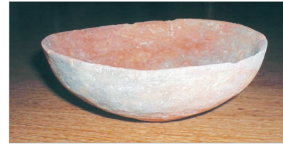
مستند ٦: وعاء من العصر المعدني.

كذلك طوّر الإنسان الزراعة، وأصبح يعتمد عليها اعتماداً أساسياً في معيشته، فضلاً عن اعتماده على تربية المواشي. وطرور أيضاً أسلحته، فصنع المناشير والسكاكين من الصوّان، وجعل للفؤوس والمطارق مقابض خشبية.