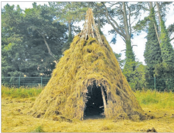
مستند ٤: بيت الإنسان القديم.

دام هذا العصر نحو أربعة آلاف سنة. ضربت فيه موجات من الصقيع الأرض، فلبجأ الإنسان إلى المغاور والكهوف ليحمي نفسه من البرد والصقيع. وعرف الإنسان في هذا العصر تطورًا في الأسلحة، فصنع رؤوس حراب (رماح) صغيرة من الحجر الصوان (Silix) أو العظام، وثبتها على رؤوس عصي خشبية. كذلك دجن الإنسان الحيوانات، أي جعلها أليفة، منها الماعز، والكلب، وبدأ المحاولات الأولى للزراعة، فزرع القمح والشعير والكرمة (العنب)، وبنى بيوته من الأغصان والطين، فبدأت القرى بالظهور.