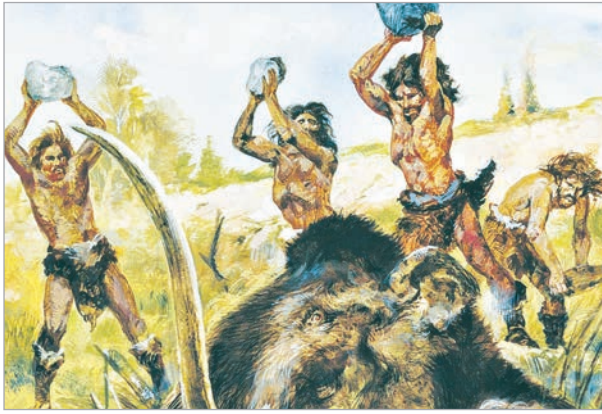
مستند ٢: يصطادون بواسطة الحجارة.

وكشفت الدراسات التاريخية والحفريات الأثرية، أن الإنسان عاش في هذا العصر عاريًا، يأكل الأعشاب البرية، وثمار الأشجار، ولحوم الحيوانات التي يصطادها. ودافع عن نفسه بواسطة الحجارة والأخشاب والعظام التي استخدمها كأسلحة. واكتشف النار، فاستعملها لإعداد طعامه، ولتدفئة وإخافة الحيوانات.