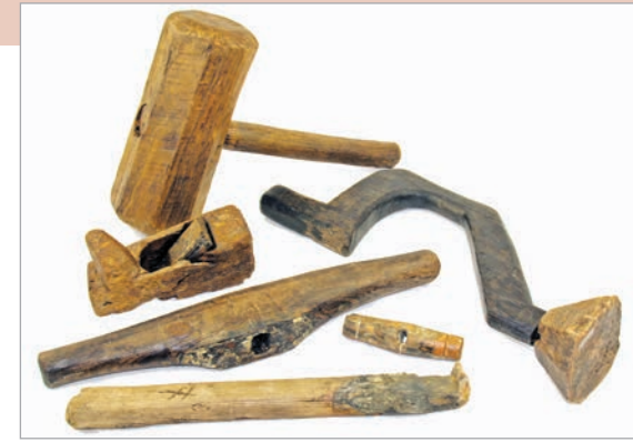
مستند ٥: أدوات للزراعة وطحن الحبوب من العصر الحجري.