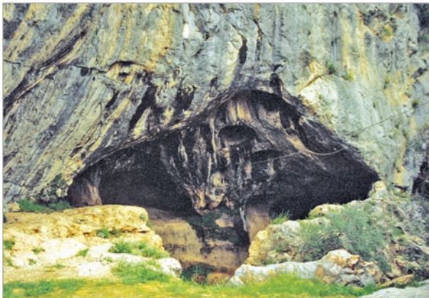
مستند ٣: مغارة كاربين في أنطاكية.

وكشفت الدراسات التاريخية والحفريات الأثرية، أن الإنسان عاش في هذا العصر عاريًا، يأكل الأعشاب البرية، وثمار الأشجار، ولحوم الحيوانات التي يصطادها. ودافع عن نفسه بواسطة الحجارة والأخشاب والعظام التي استخدمها كأسلحة. واكتشف النار، فاستعملها لإعداد طعامه، ولتدفئة وإخافة الحيوانات.