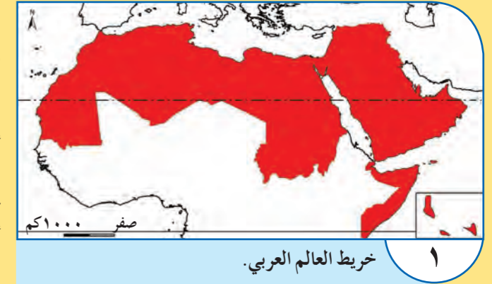
خريطة العالم العربي.

يظهر «العالم العربي» على الشكل المبين في الخريطة (مستند ١). فأين يقع العالم العربي على خريطة العالم وبالنسبة للقارات؟ أية محيطات وبحار تحيط بالعالم العربي؟ وأية ممرات بحرية يشرف عليها؟ أية مناطق طبيعية تحد العالم العربي؟ وما هي أهمية موقعه؟