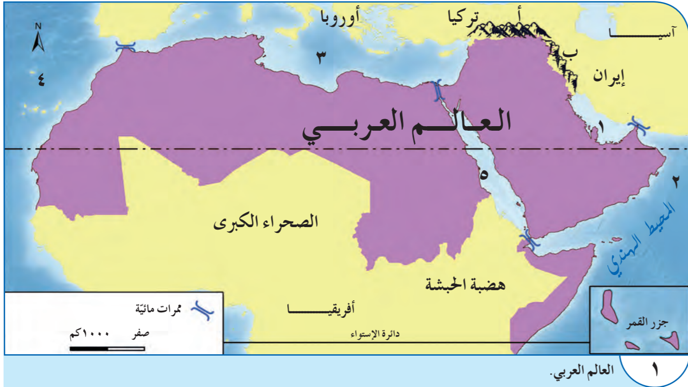
١ العالم العربي.