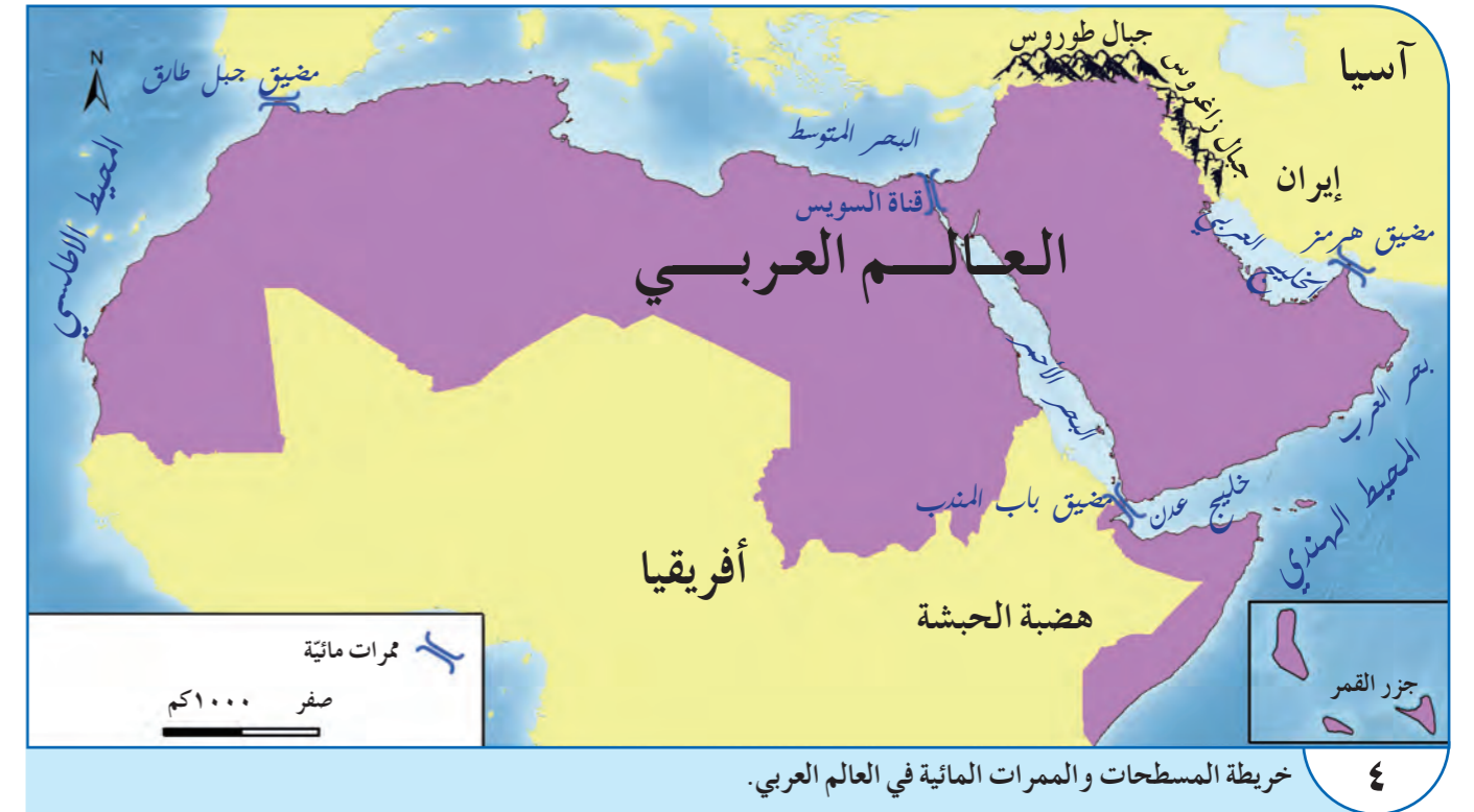
٤ خريطة المسطحات والممرات المائية في العالم العربي.

رابعاً: من خلال المستند رقم (٤)، أربط أسماء الممرات المائية في العمود الأول بالمسطحات المائية التي تصل بينها في العمود الثاني: