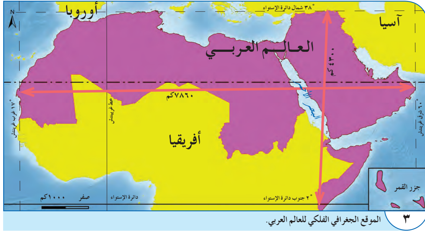
الموقع الجغرافي الفلكي للعالم العربي.

يظهر «العالم العربي» على الشكل المبين في الخريطة (مستند ١). فأين يقع العالم العربي على خريطة العالم وبالنسبة للقارات؟ أية محيطات وبحار تحيط بالعالم العربي؟ وأية ممرات بحرية يشرف عليها؟ أية مناطق طبيعية تحد العالم العربي؟ وما هي أهمية موقعه؟