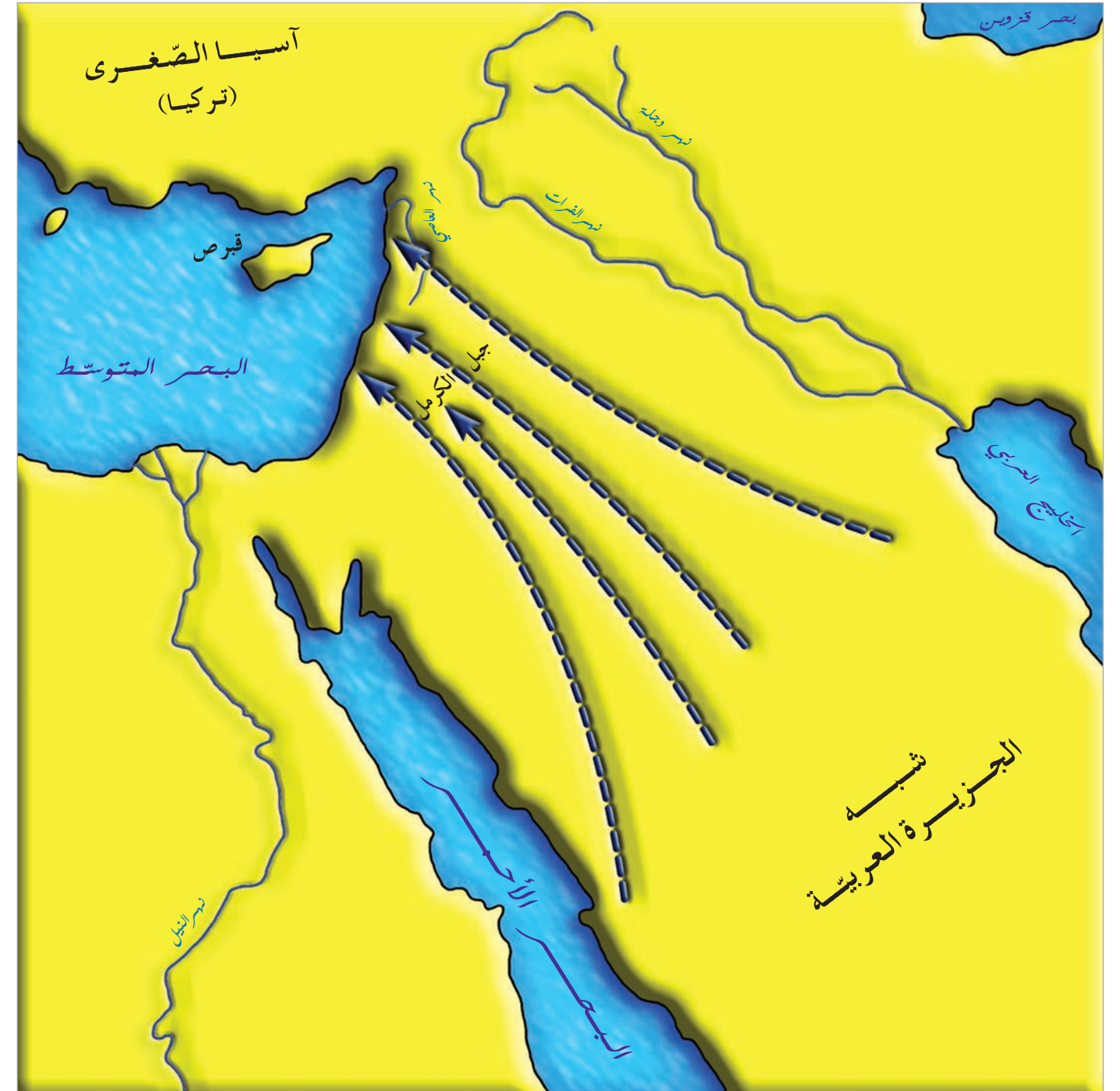
مستند ١: خريطة الانتشار الفينيقي على شواطئ البحر المتوسط.