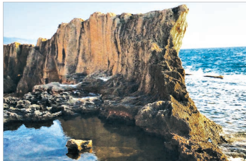
مستند ٣: السور الفينيقي في البترون.