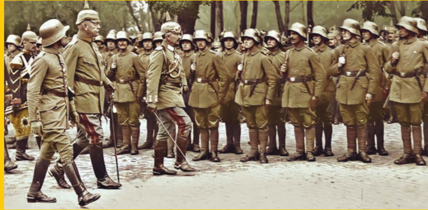
قوات ألمانية خلال الحرب العالمية الأولى