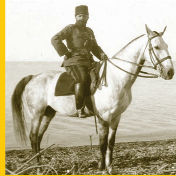
جمال باشا على شاطئ البحر الميت سنة ١٩١٥