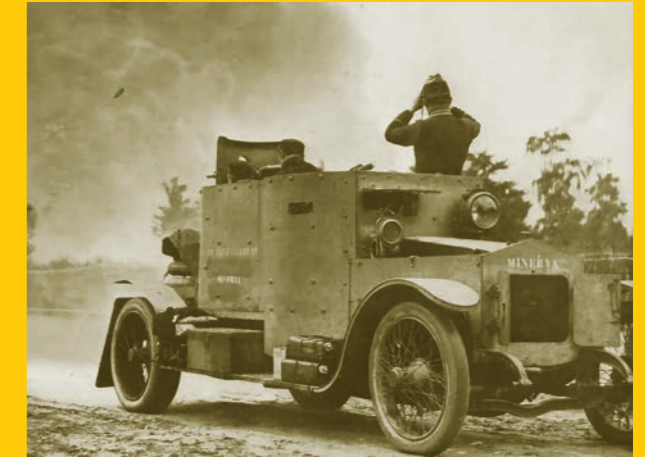
آلية عسكرية بلجيكية