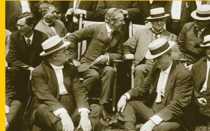
في الوسط رئيس الولايات المتحدة الأميركية وودرو ويلسون