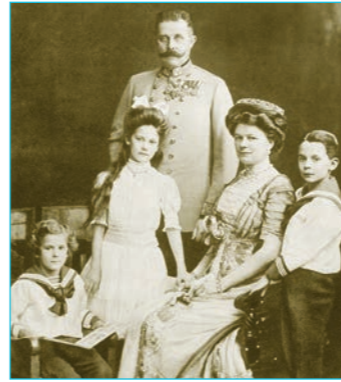
فرنسوا فرديناند وزوجته صوفي وأولادهم سنة ١٩١٠