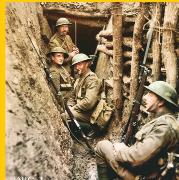
جنود بريطانيون داخل الخندق