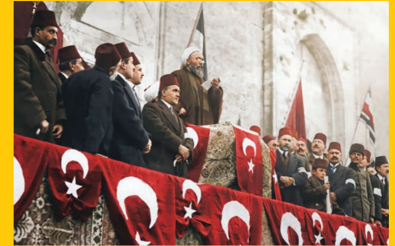
السلطنة العثمانية تعلنُ الجهاد المقدس (تشرين الثاني)