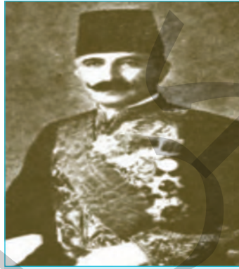
المستند ٧: إسماعيل حقي (١٩١٧ - ١٩١٨).