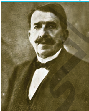
المستند ٩: حبيب باشا السعد (١٨٦٧ - ١٩٤٢).

دخل الجيش العثماني إلى جبل لبنان عن طريق البقاع - زحلة - زهور الشوير في ٢٢ تشرين الثاني ١٩١٤، واحتلّ الأديرة والكنائس وحولها ثكنات عسكرية له، واتخذ من مدينة عاليه مقراً لقيادته.